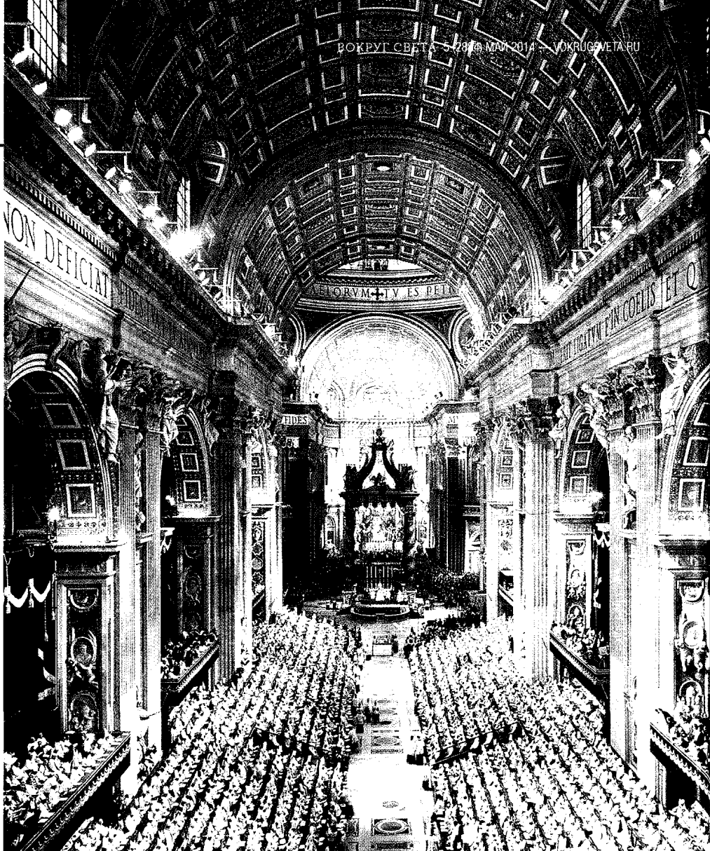
㉑ 7 чудес Италии: самый большой собор, самое чистое озеро, самая короткая река . . . . . 32