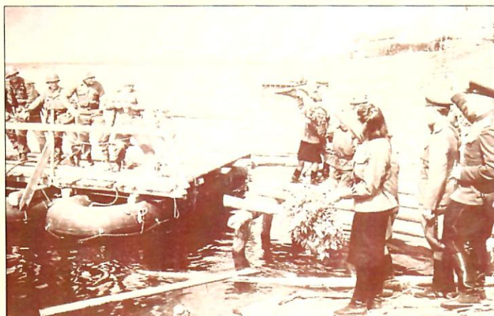
Первая встреча союзных войск на Эльбе 25.04.1945 г.

Советский ветеран называл себя, американец обра-