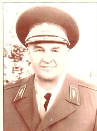
Генерал А.В. Ольшанский 1996 г.

Всенародная воля к миру привела сюда в Торгау, на Эльбу, этих пожилых людей — русских, украинцев, белорусов, американцев, англичан, французов, пожелавших отметить приближающееся пятидесятилетие Победы над гитлеровским фашизмом именно